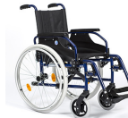
Silla de ruedas ligera