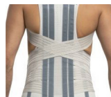
Ortesis Dorsolumbar Semirrigida OTD 020D TAYLOR