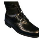
Ortesis dinámica antiequino OIT 060D