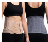
Ortesis Lumbosacra Semirrigida OTL 000B