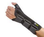
Pasiva muñeca y pulgar OSM 000A