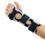
Pasiva muñeca OSN 000A