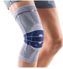
Estabilizadora con rodete