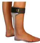
Rancho de los amigos OIT 060A estándar OIT 060B a medida