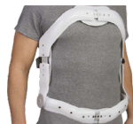
Ortesis de Jewett OTD 080A