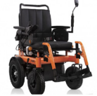
Silla eléctrica (PE)

SRE000A SRE000B (infantil) SRE000C (>130kg)