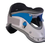
Collarín Rígido OTC 010A