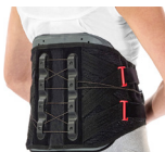
Ortesis Rígida OTL 010A