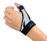
Estabilizadora pulgar OSD 000A