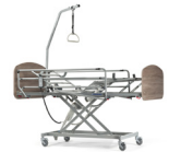
Cama con las funciones de hospitalización